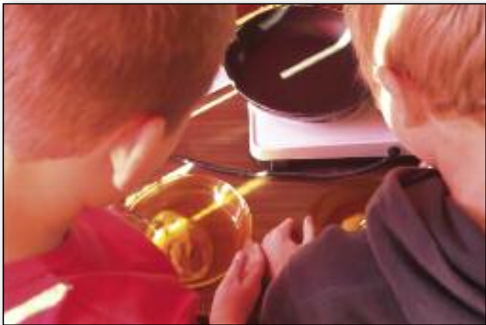
Pour faire du pain perdu, il faut tout d'abord battre un œuf !