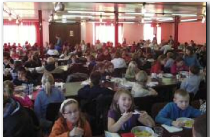
Il est midi. Les activités du matin m'ont ouvert l'appétit !

La Ville de Gembloux remercie toutes les personnes qui ont contribué à faire de cette journée un moment inoubliable pour les enfants !