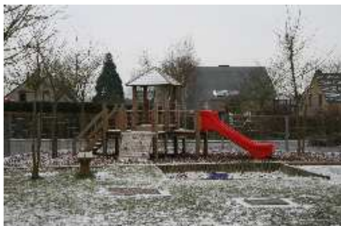
Le module de jeux du côté des classes maternelles, adapté aux plus petits, un bac à sable, un petit train en bois et divers véhicules constituent un bel espace de loisirs, entièrement clôturé.