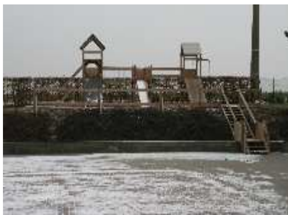
Un espace de jeux dédié aux enfants du primaire avec tables et bancs