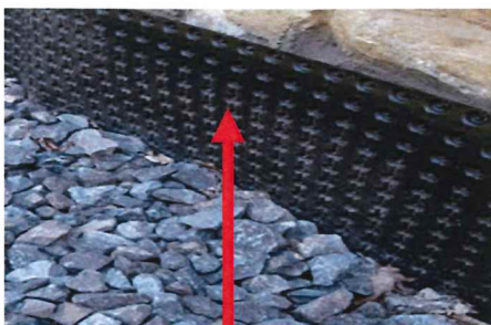
Protection murale étanche