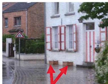
Rehausse de soupirail