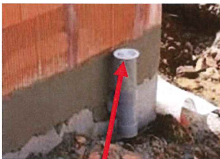
Rehausse de conduits d'aération