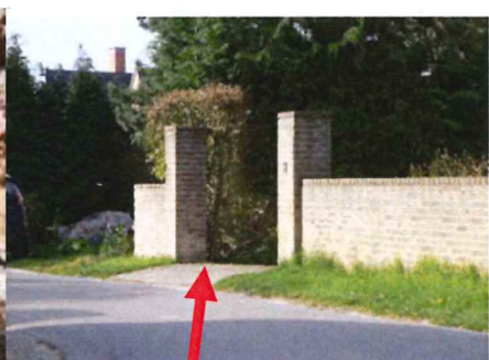
Dos d'âne au portail d'entrée

Et en dernier lieu, il faudra protéger ce qui risque malgré tout d'être touché par l'eau. Ainsi par exemple, surélever les machines et les armoires, enlever les tapis, etc. Il est aussi malin de garder à portée de main quelques outils : pelle, râteau, brosse et raclette, pompe vide-cave, bottes et lampe de poche.