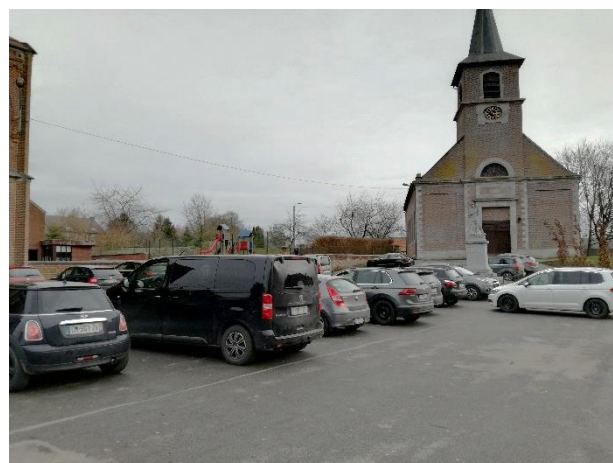
Place de Grand-Leez, vue depuis l'église (à gauche) et depuis le monument (à droite)

La place est constituée d'un simple revêtement d'asphalte qui sert de parking pour les personnes qui fréquentent l'école ou l'EGL. Un monument aux morts est implanté au centre de l'espace. Au sol, un terrain de balle pelote est délimité, témoignant que ce sport traditionnel est encore vivant dans le village.