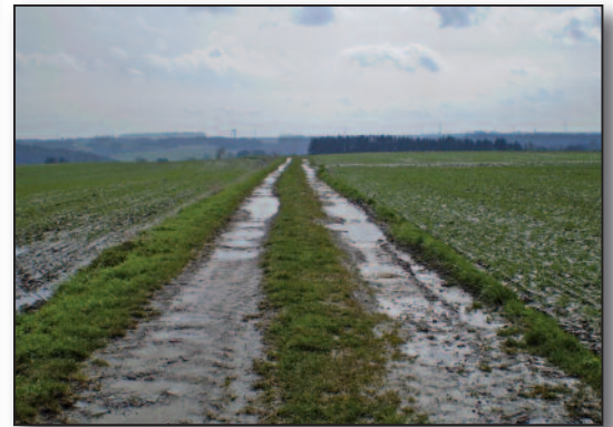
rue des Sarts avant