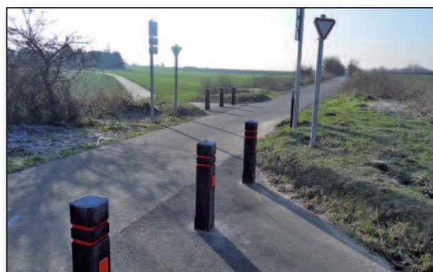
rue de la Marcelle à la hauteur du Ravel