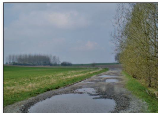
rue Baty d'Ernage avant