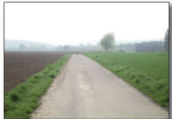
rue des Sarts après