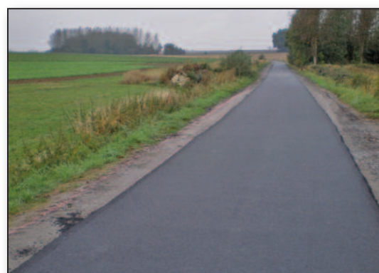
rue Baty d'Ernage après