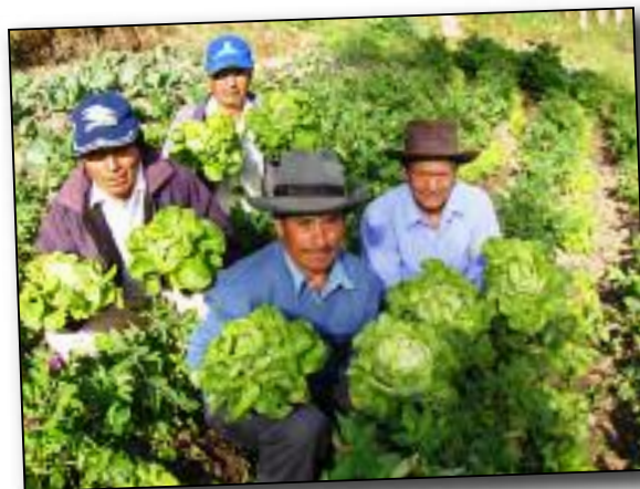
Formation légumes biologiques au Pérou

Au Nord, des actions de sensibilisation sont mises en place dans les écoles, notamment en collaboration avec la Ville de Gembloux et le Centre Culturel. Ces actions visent la conscientisation des jeunes aux enjeux de la mondialisation en leur expliquant que tout se joue ici aussi, par nos comportements de consommateurs - consomm'acteurs.