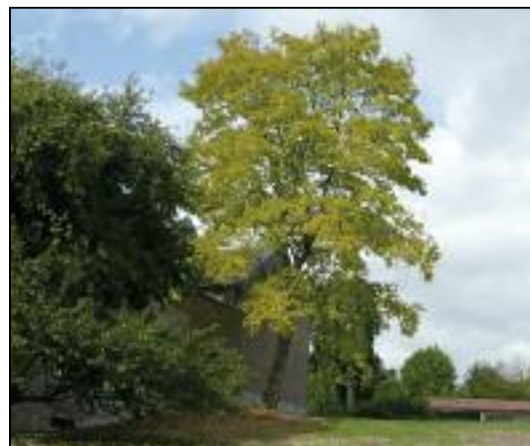
Promenade « Arbres et haies de Bossière » n5: Robinier faux acacia dore Robinia pseudoacacia 'Frisia' Arbre magnifique BO3

Carrefour, entre la rue du Pont des Pages, la rue Taravisée et rue Henri de Leez. Chapelle de Notre-Dame des sept Douleurs. Une inscription sur la façade date sa construction en 1753. Les tilleuls sont très souvent associés à des chapelles et autres lieux de culte.