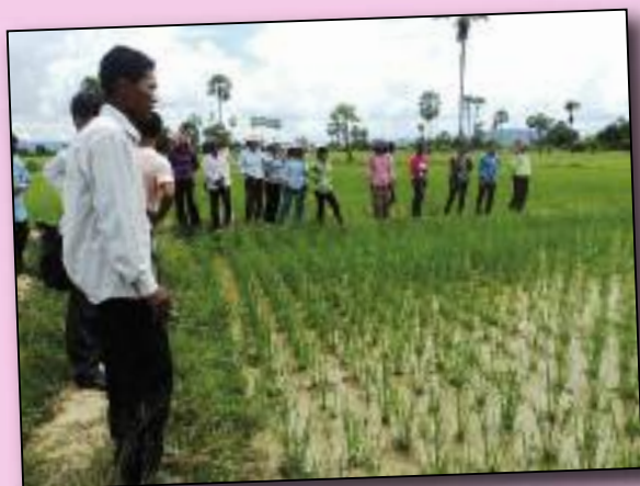
Visite de champs au Cambodge