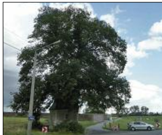
Promenade « Arbres et haies de Grand-Leez » n1: Tilleul de Hollande / Tilia X europaea Arbre Remarquable A.R. 14

Intéressés par la démarche ? Le PCDN est ouvert à tous !