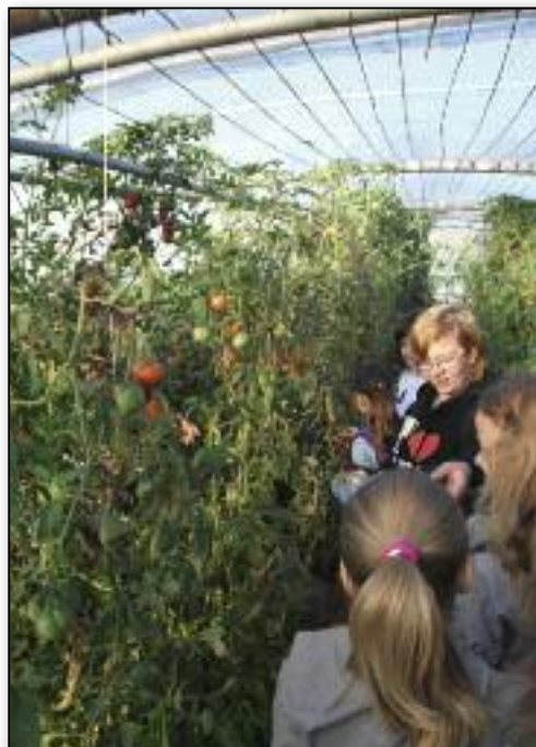
Découverte de différentes variétés de tomates dans les serres du Centre Technique Horticole