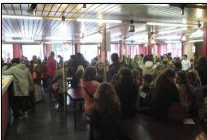
Il est 9 h. Les enfants font la connaissance de leurs Passe-Murailles avec qui ils vont passer la journée.

Petit zoom arrière sur la journée Place aux enfants qui s'est déroulée le samedi 15 octobre dernier à Gembloux. Sous un soleil radieux, 175 enfants âgés entre 8 et 12 ans sont partis à la découverte du monde des adultes... En voici quelques souvenirs.