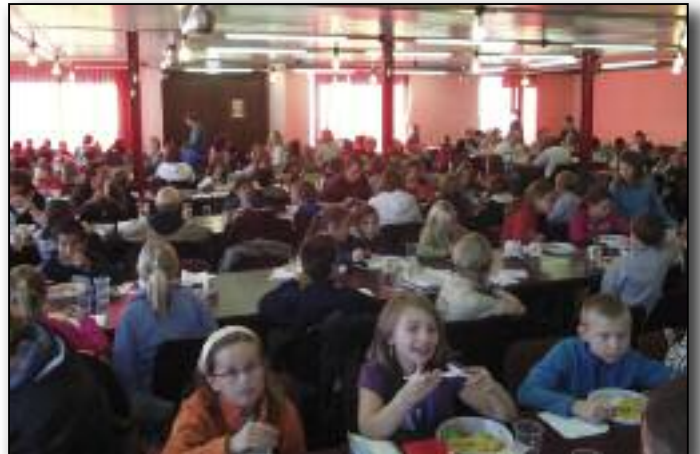
Il est midi. Les activités du matin m'ont ouvert l'appétit !

La Ville de Gembloux remercie toutes les personnes qui ont contribué à faire de cette journée un moment inoubliable pour les enfants !