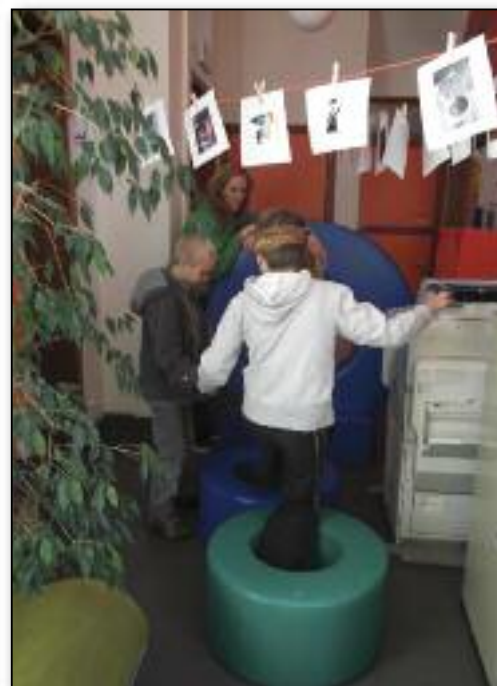
« Ce n'est pas facile de surmonter tous ces obstacles dans le noir » (Simulation d'une nuit d'exil dans le cadre de l'activité « une girafe sous la pluie » à l'Espace Communautaire)