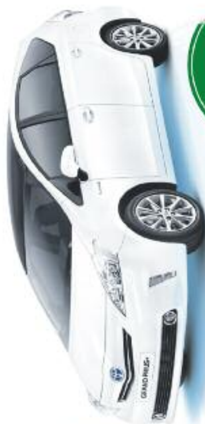
Grand Prius+ 7 places

AVANTAGE TOUTE NATURE APD €100 + RICHEMENT EQUIPÉS