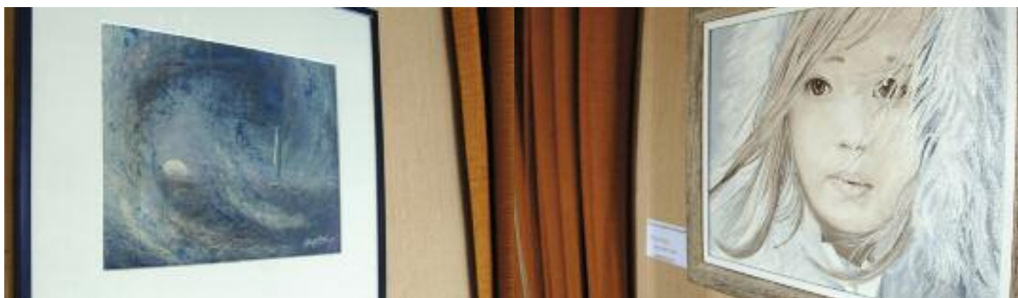
1er Prix de la Ville de Gembloux 2011 « Impression marine, aube » Renée Vingerhoed

visiteurs s'y sont rassemblés. Tous ont témoigné de leur enthousiasme pour cette manifestation de belle qualité... On en redemande, donc !