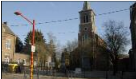
Ecole de Mazy

Proches du milieu de vie de l'enfant, de la nature, dans une ambiance conviviale, à l'écoute des problèmes et dans le respect des opinions philosophiques de chacun, les écoles de l'entité vous proposent un enseignement communal de qualité, des activités culturelles et sportives, des classes de dépaysement, l'apprentissage précoce du néerlandais, des jardins didactiques, des excursions, etc.