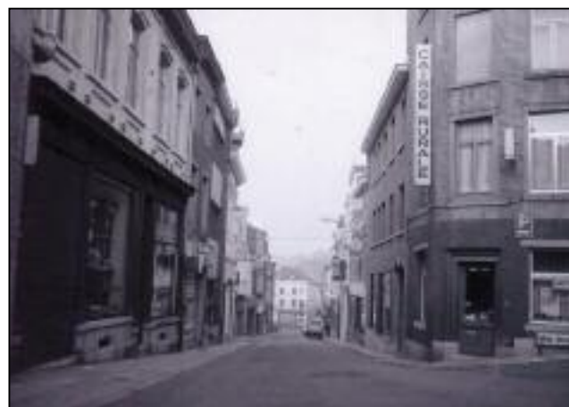
La Grand Rue dans les années 1960

L'occasion également pour les commerçants de remercier particulièrement leur clientèle lors des Fêtes de Wallonie, le 22 septembre. La liste des commerçants participants est en ligne sur www.journeeduclient.be